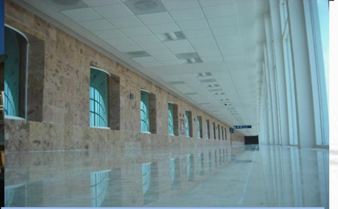
REUBICACION DE LOCALES COMERCIALES